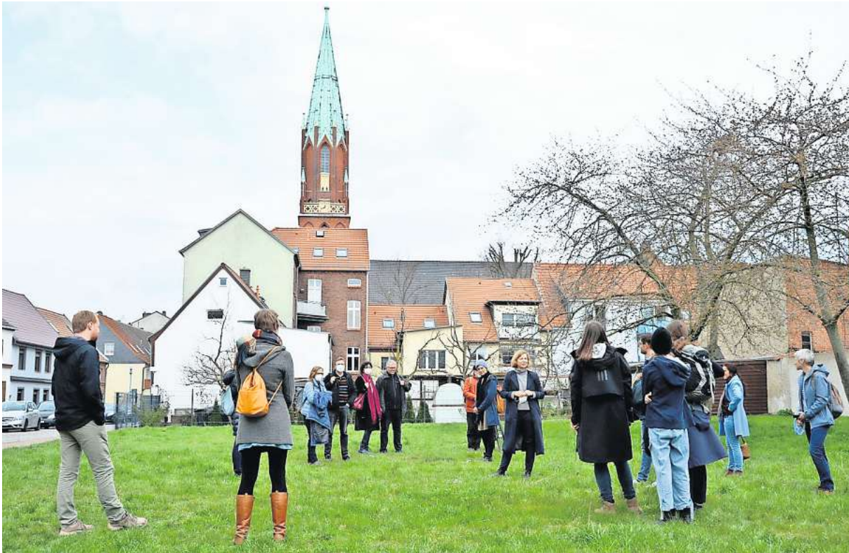
Viele Interessierte kamen am Sonntag in die Wittenberger Altstadt, um sich über die Pläne in der Burgstraße zu informieren. Dort sollen auf der jetzigen Freifläche 13 Wohnungen entstehen.

Interessierte hatten die Möglichkeit, sich vorzustellen, kennen zu lernen und mehr über die geplante Baugemeinschaft zu erfahren. Hinzu kommt bei vielen der Wunsch, von der Großstadt aufs Land zu ziehen und trotzdem in einer Gemeinschaft zu wohnen. Nicht nur der Trend zum Homeoffice, der den Wohnort immer unabhängiger vom